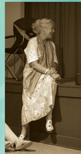
В Халсионе (2009 г.)