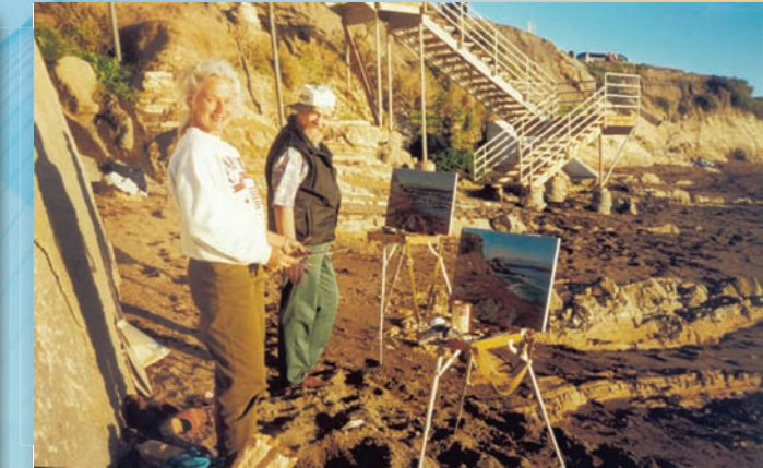
Совместный пленэр на берегу Тихого океана (1998 г.)