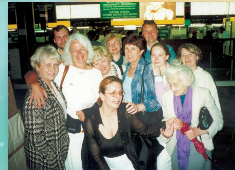
После визита в «Дельфис» в Москву. Прощание в аэропорту (2000 г.)