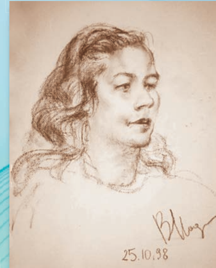
Л.Роллисон. Рис. В.Надёжина