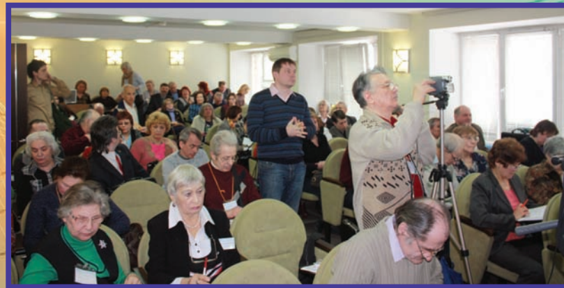
В зале конференции